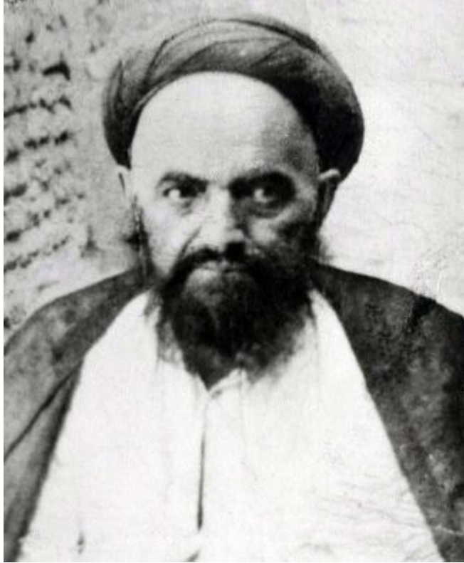
تصویر عارف کامل مرحوم آیه الله العظمی و حجة الله اکبر سید علی قاضی - قدس الله سره - در اواخر عمر.