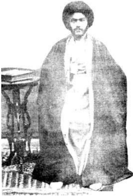
تصویر مرحوم علامہ قاضی - رضوان اللہ علیہ - در جوانی .