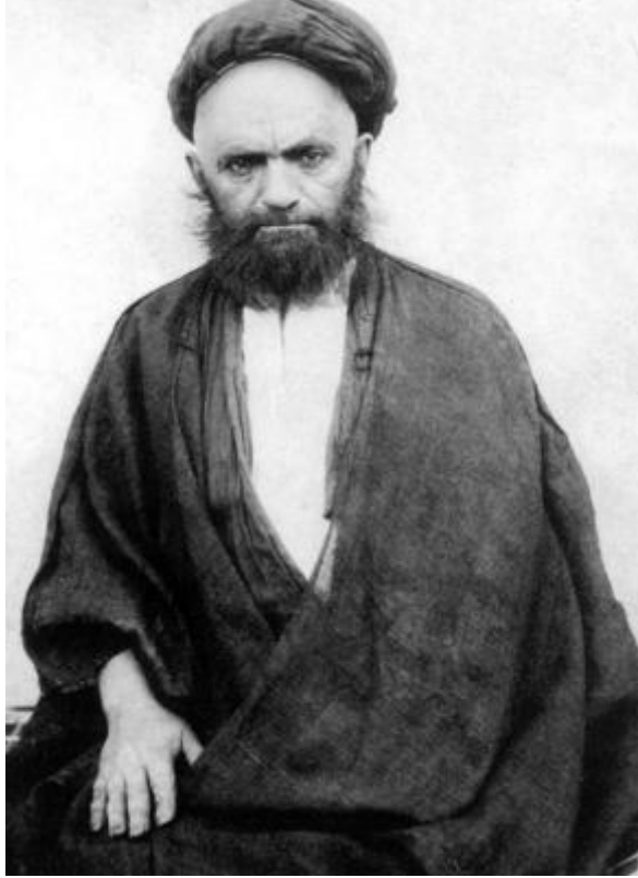
تصوير عارف كامل واصل، مرحوم آية الله العظمى علامه قاضى، رضوان الله عليه